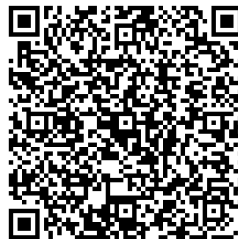
Wasserreich. An Dahme und Spree.