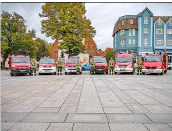
AG Öffentlichkeitsarbeit aller Lübbener Ortswehren