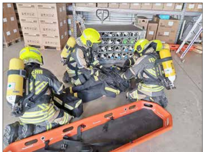
Training des Einsatzes unter Atemschutz