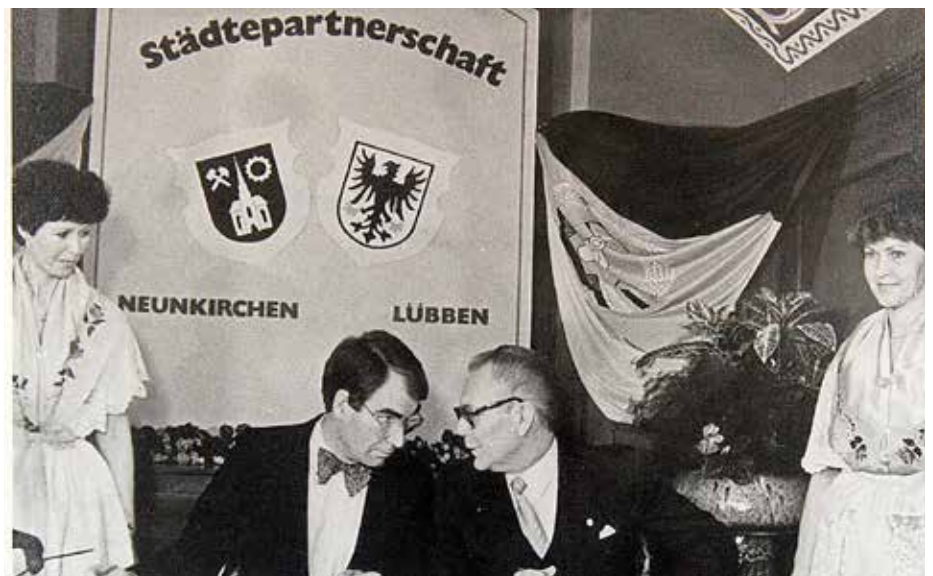
Vertragsunterzeichnung mit Neunkirchen

Anlässlich des 10. Jahrestages der Städtepartnerschaft zwischen Lübben und Wolsztyn wird in Lübben der „Wolsztyn Platz“ an der Gubener Straße eingeweiht. Die Platzfläche wird von Großpflaster eingefasst und mit Granitblöcken aus der früheren Jägerkaserne abgegrenzt. Tafeln informieren über die Partnerstadt Wolsztyn. Der Hauptausschuss der Stadtverordnetenversammlung beschließt die Namengebung am 18.8.2003.