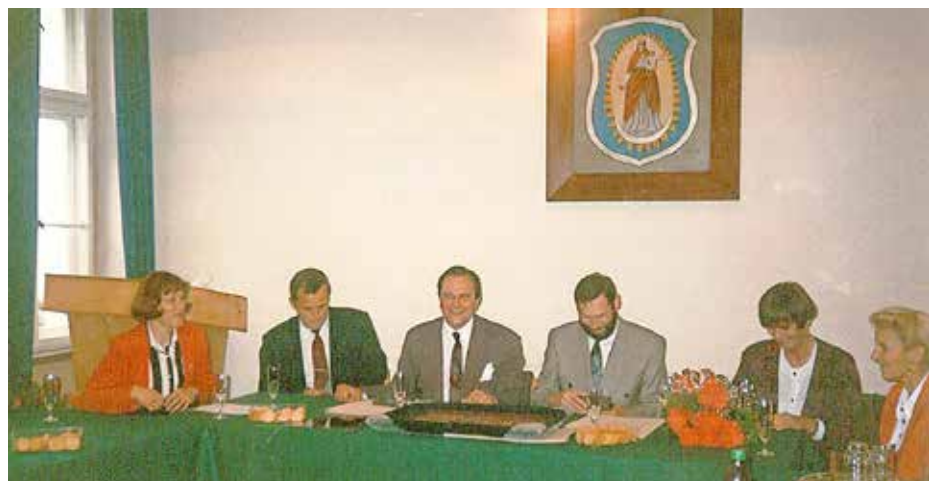
Vertragsunterzeichnung mit Wolsztyn