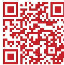
Insta | Museum @museum_luebben