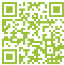
News | Tourismus luebben.de/tourismus