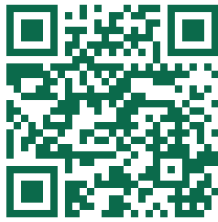
Insta | Rathaus @stadtlauebbenspreewald