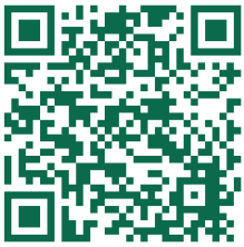
News | Rathaus luebben.de