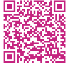
News | Stadtleben luebben.de