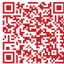
Museum Schloss Lübben museum-luebben.de