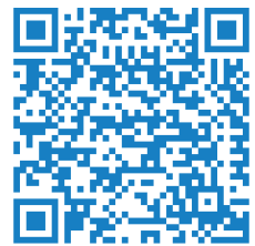
Stadtbibliothek Lübben luebben.de/stadtbibliothek