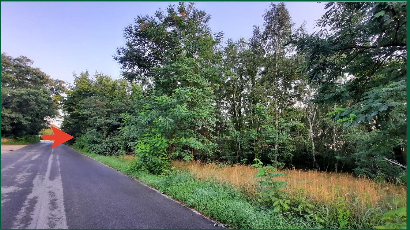
Abbildung 1: Stadt Lübben, K. Pötschick