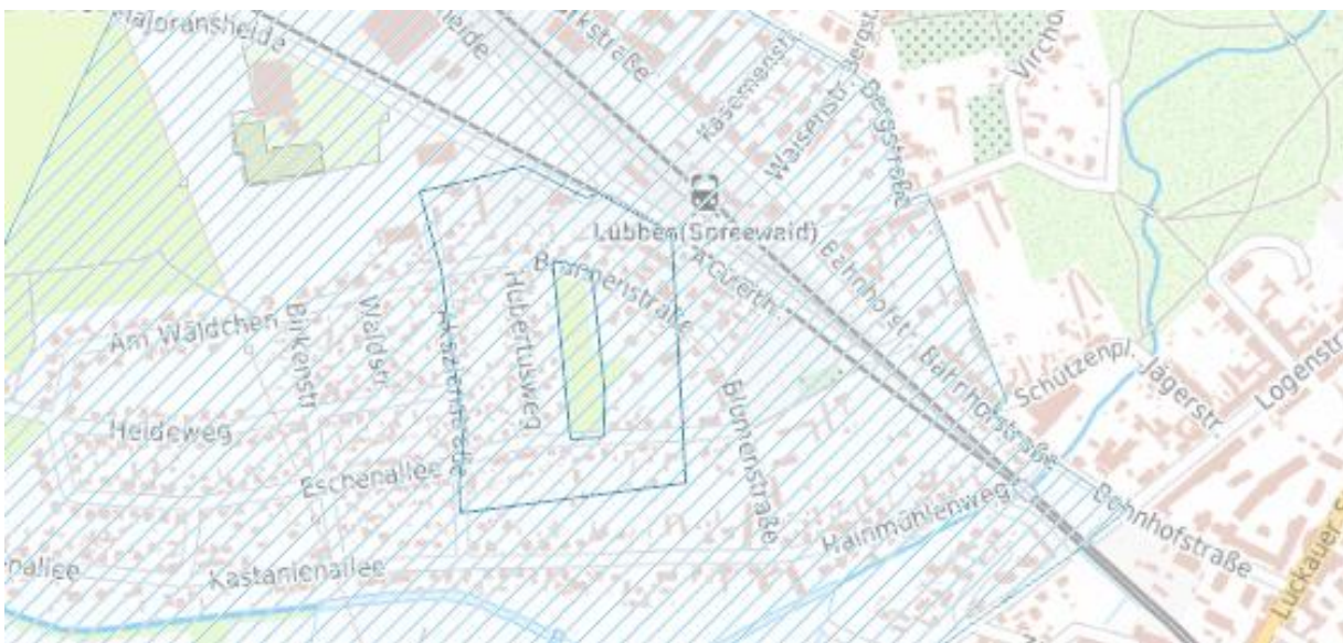
Abbildung 5: Geoportal.de

Wasserschutz: Das Grundstück befindet sich innerhalb des Wasserschutzgebietes. Dieses ist in nachfolgender Abbildung blau markiert.