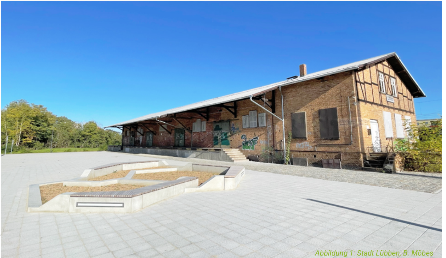
Abbildung 1: Stadt Lübben, B. Möbes