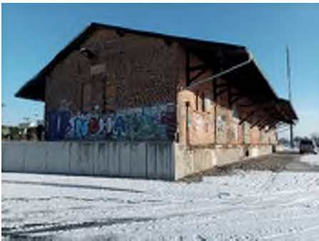
Abbildung 7: Stadt Lübben, B. Möbes

Das Gebäude steht seit 2006 leer. Das Grundstück ist lediglich bahnseitig durch einen Zaun abgegrenzt. Straßenseitig besteht keine Einfriedung.