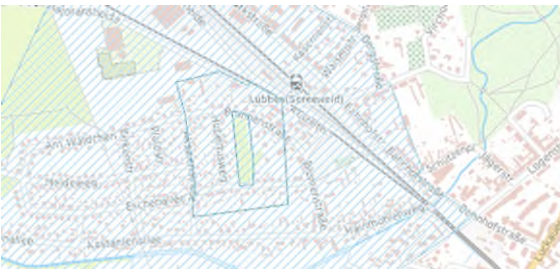
Abbildung 7: Geoportal.de

Wasserschutz: Das Grundstück befindet sich innerhalb des Wasserschutzgebietes.