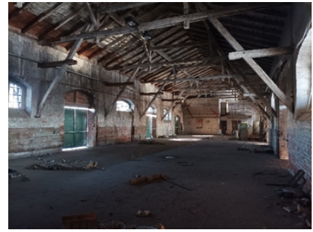
Abbildung 9: Stadt Lübben, B. Möbes