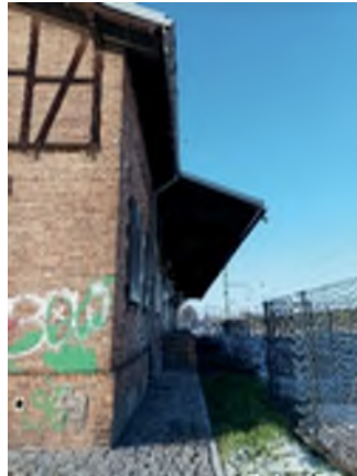
Abbildung 8: Stadt Lübben, B. Möbes