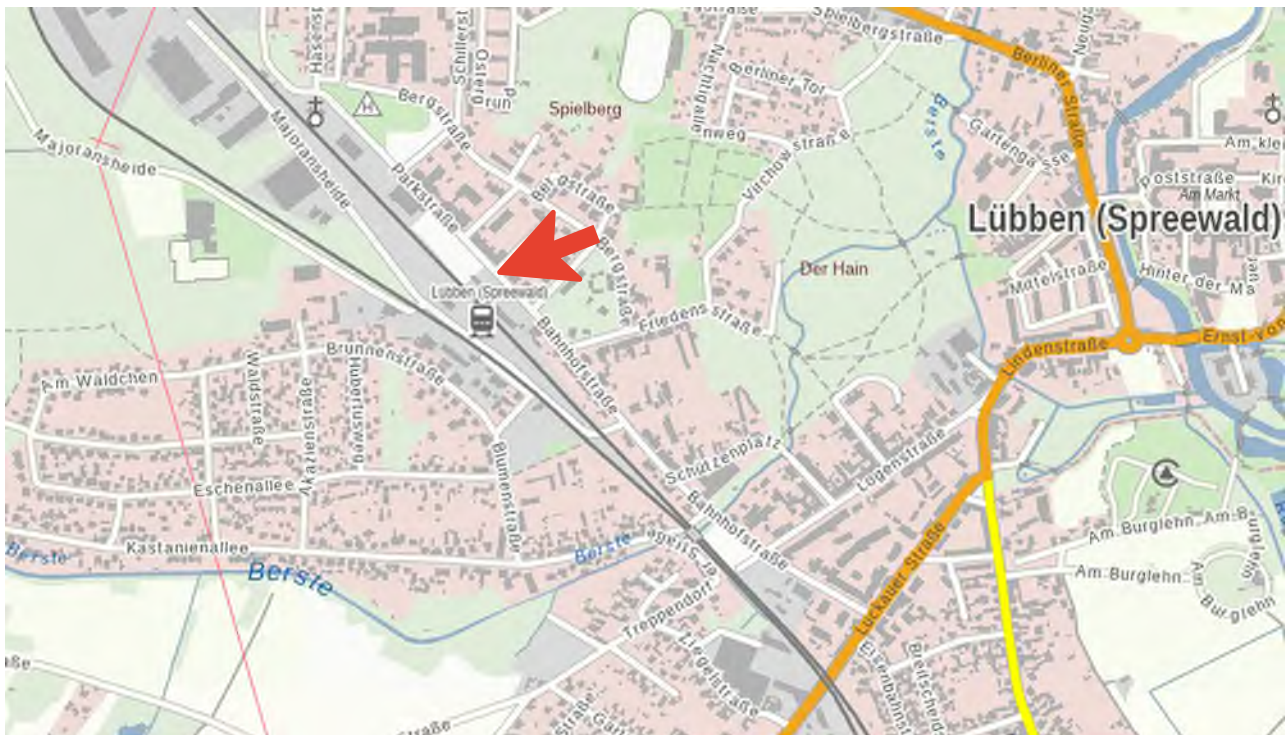
Abbildung 3: LGB Brandenburg Viewer