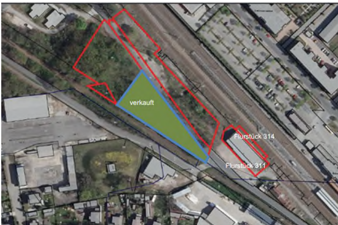
Abbildung 8: Archikart

Durch die unmittelbare Anbindung an den Lübbener Bahnhof unter der Berücksichtigung der geplanten Fortführung des Personentunnels zwischen Bahnhof und Lübben-West weist das Grundstück eine vielversprechende Lagegunst auf. Mit dem Bahnhof als mittelstädtischer Mobility Hub sowie „Tor zum Spreewald“ für den touristischen Verkehr eröffnen sich für den Bestandsbau mit Industriecharakter städtebauliche Entwicklungschancen mit potenziell überregionaler Zugkraft.