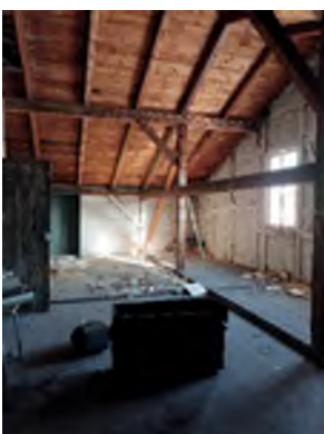
Abbildung 5: Stadt Lübben, B. Möbes