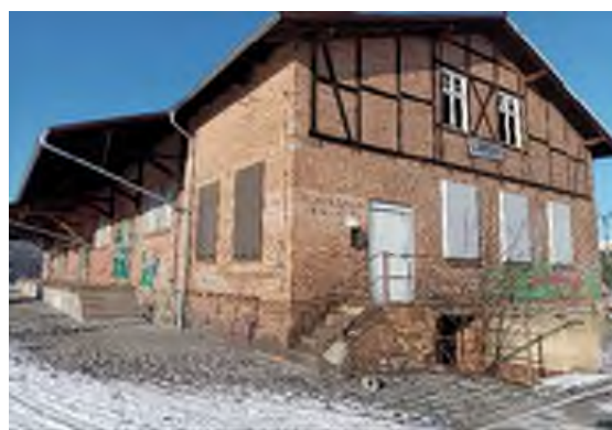
Abbildung 6: Stadt Lübben, B. Möbes